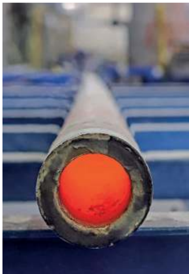
Реакционные трубы, сделанные в Тольятти, выдерживают температуру свыше 1000°C

Основные решения – это параллельный импорт, маршруты альтернативных поставок. Помогает выход на азиатский рынок по запчастям. Кроме того, компания ведет диалог с производителями из Китая, готовыми поставлять машины центробежного литья.