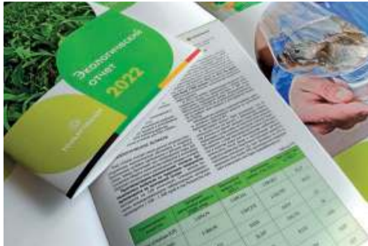
Более 194 млн рублей в 2022 году инвестировал «Тольяттиазот» в природоохранные программы

Ежегодная подготовка сведений об экологической безопасности предприятия в регионе присутствия – обязательное условие деятельности ТООЗа. Экологический отчёт – структурированный документ, включающий подробную информацию о влиянии факторов деятельности завода на окружающую среду и мерах по ее сохранению. Данные за год анализируют, направляют в контролирующие органы (Роспотребнадзор и Росприроднадзор) и публикуют на официальном сайте компании. В 2022 году ТООЗ реализовывал программы снижения общего количества выбросов в атмосферу, сбросов сточных вод и размещения твердых отходов. На