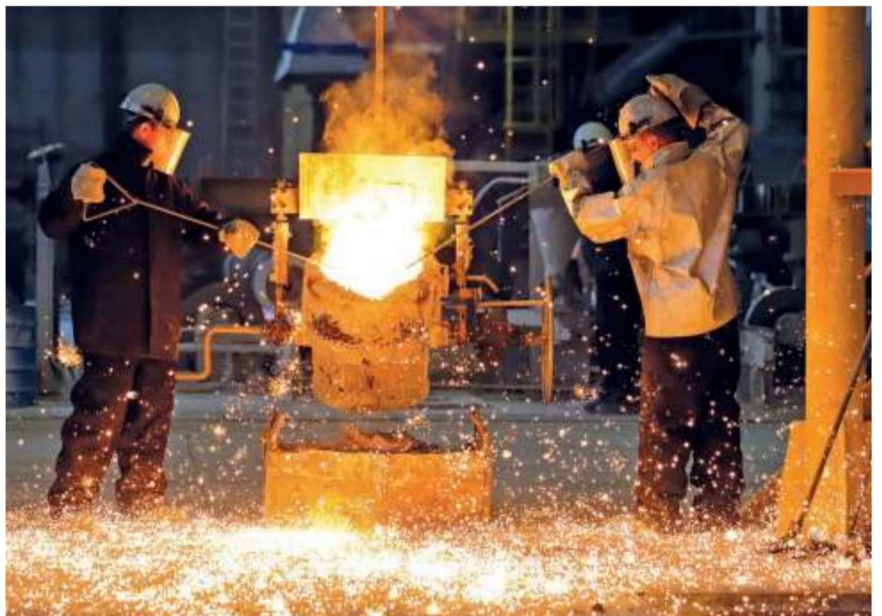
Металлургический спецназ – такие ассоциации рождает работа уникального производства. Специалисты «Реакционных труб» не спорят: так и есть